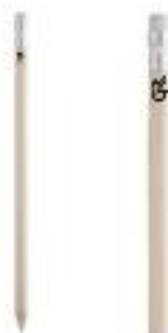
CERUZKA GJAR 1,50€