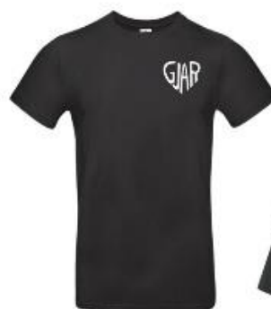
13€ TRIČKO S MERCHOM