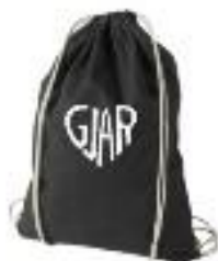
VAK GJAR 6€