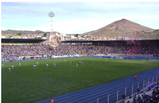
Pohľad na štadión a horu Cerro Rico.