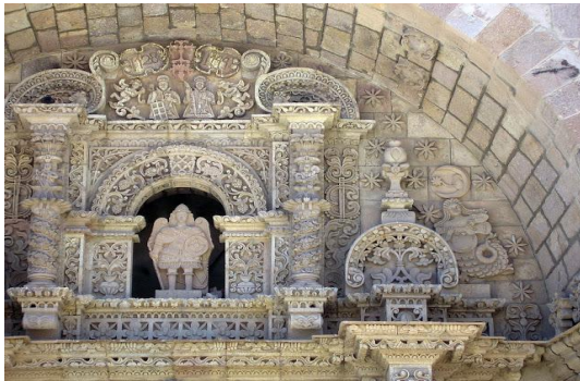
Baroková výzdoba na Kostole sv. Lorenza.

Mesto má aj svoj futbalový klub – Real Potosí, ktorý hrá svoje zápasy na 32-tisícovom štadióne Estadio Víctor Agustín Ugarte. Tento štadión je s výškou 3960 m n. m. najvyššie položeným štadiónom na svete. Väčšina tímov, ktoré nie sú zvyknuté na takúto výšku, má problémy v zápasoch s týmto klubom, keďže ich hráči ledva dohrávajú zápas. FIFA niekoľkokrát zakázala hrať futbalové zápasy vo väčšej výške ako 3000 m n. m., no neskôr urobila zopár úprav a výnimiek, a tak sa na tomto štadióne hrajú zápasy (i reprezentačné) aj naďalej.