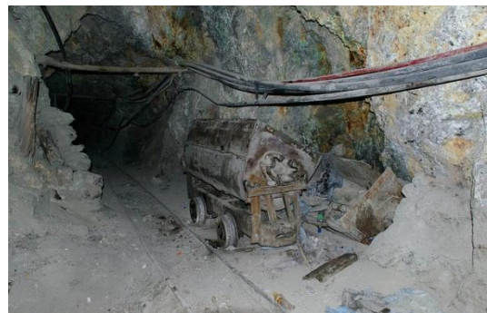
Vo vnútri jednej z baní.