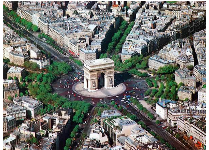
Arc de Triomphe de l'Étoile