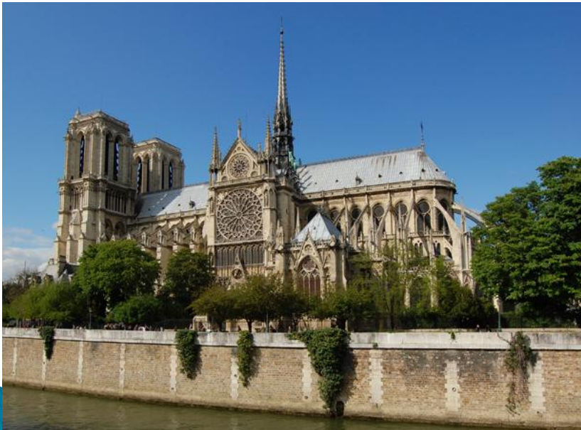
Katedrála Notre Dame