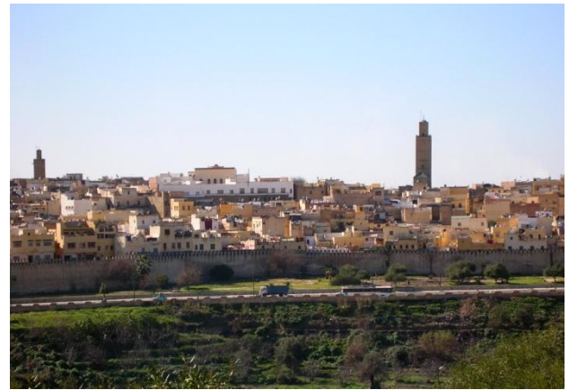
pohľad na mesto