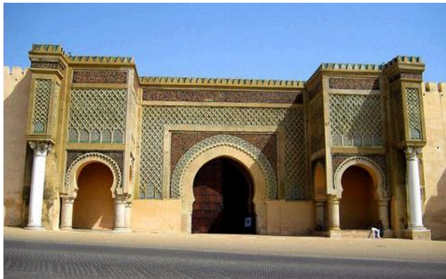
Bob Mansour, najkrajšia brána Meknesu