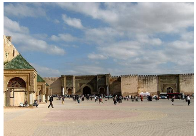
námestie Plaze El Mehdim

Zdroje: http://en.wikipedia.org/wiki/Meknes , http://www.visitmorocco.com/index.php/eng/I-am-going-to/MEKNES/Unmissable , http://whc.unesco.org/en/list/793 , http://www.completemorocco.com/destinations-in-morocco/cities-of-morocco/meknes/ , http://www.virtourist.com/africa/morocco/meknes/index.html , http://wikitravel.org/en/Meknes , http://www.walkers.sk/volubilis.php