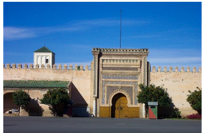
vstup do paláca Dar El Mekhezen