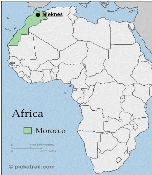
poloha Meknesu(na mape Afriky)