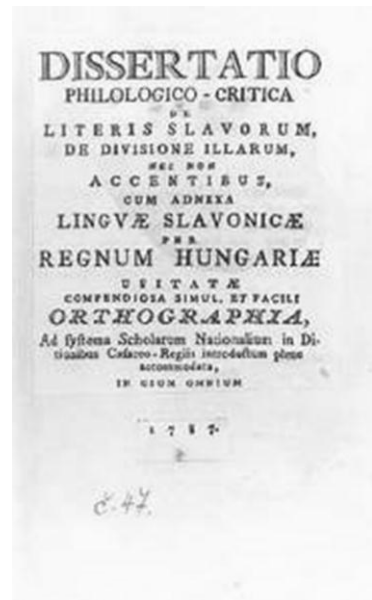
Titulný list práce A. Bernoláka Filologicko – kritická rozprava o slovenských písmenách