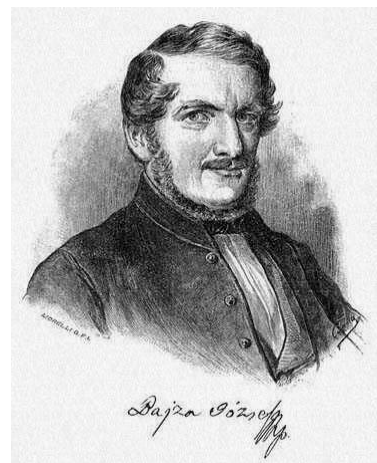
Jozef Ignác Bajza

Najväčším problémom národovcov v tejto etape bol boj proti silnejúcej ..... Predstavitelia tejto etapy sa pri svojich snahách opierali o ....., ktorý je základnou charakteristikou národa. Slovenská inteligencia bola na konci 18. storočia rozdelená hlavne ..... Spisovným jazykom Slovákov v tejto etape bola ....., ktorá prechádzala postupnou slovakizáciou. .... rozdielnosť sa prejavovala na Slovensku v rozdielnom vnímaní Slovákov ako súčasti ..... Katolíci chápali Slovákov ako ..... slovanského národa. Evanjelici tvrdili, že Slováci sú ako kmeň súčasťou ..... slovanského národa.