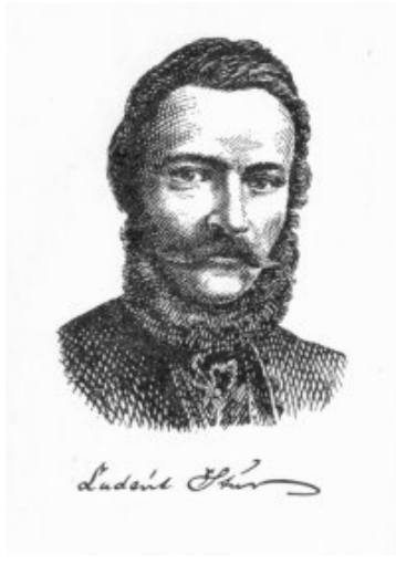
Ludovít (Velislav) Štúr