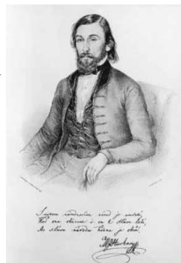
Jozef Miloslav Hurban

Centrom tretej generácie sa stala ..... ..... na bratislavskom lýceu. Študenti lýcea si založili samovzdelávacie krúžky, knižnicu a neskôr aj ....., ktorej hlavným cieľom bolo ..... ..... a ..... Okrem samovzdelávacích aktivít sa spoločnosť neskôr zamerala na ..... medzi roľníkmi a mešťanmi.