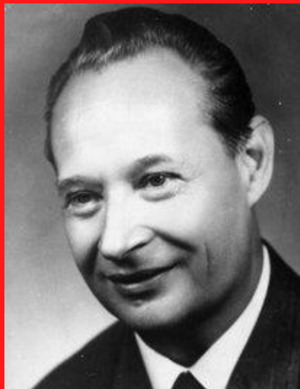
Alexander Dubček „Socialismus s ľudskou tvárou“