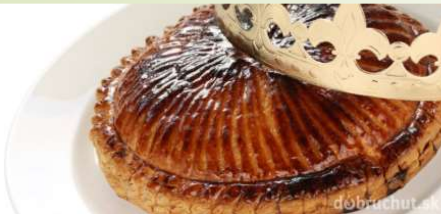
Francúzsky trojkráľový koláč