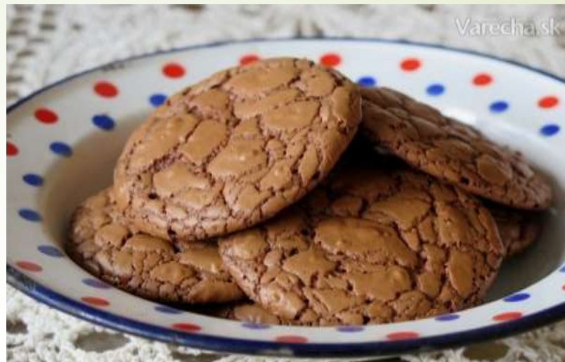
Francúzske čokoládové dukáty