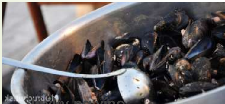
Slávky na víne