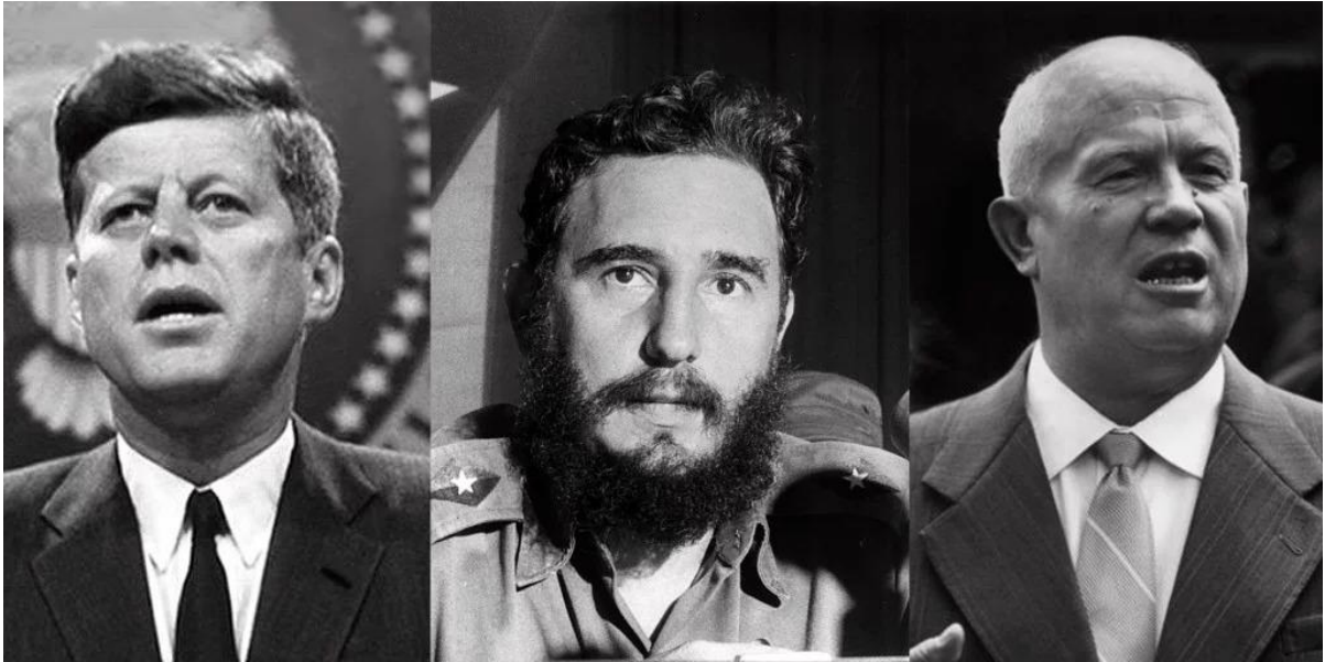
Obr. 1 - Hlavní aktéri Karibské krízy (zľava J. F. Kennedy, F. Castro, N. S. Chruščov)