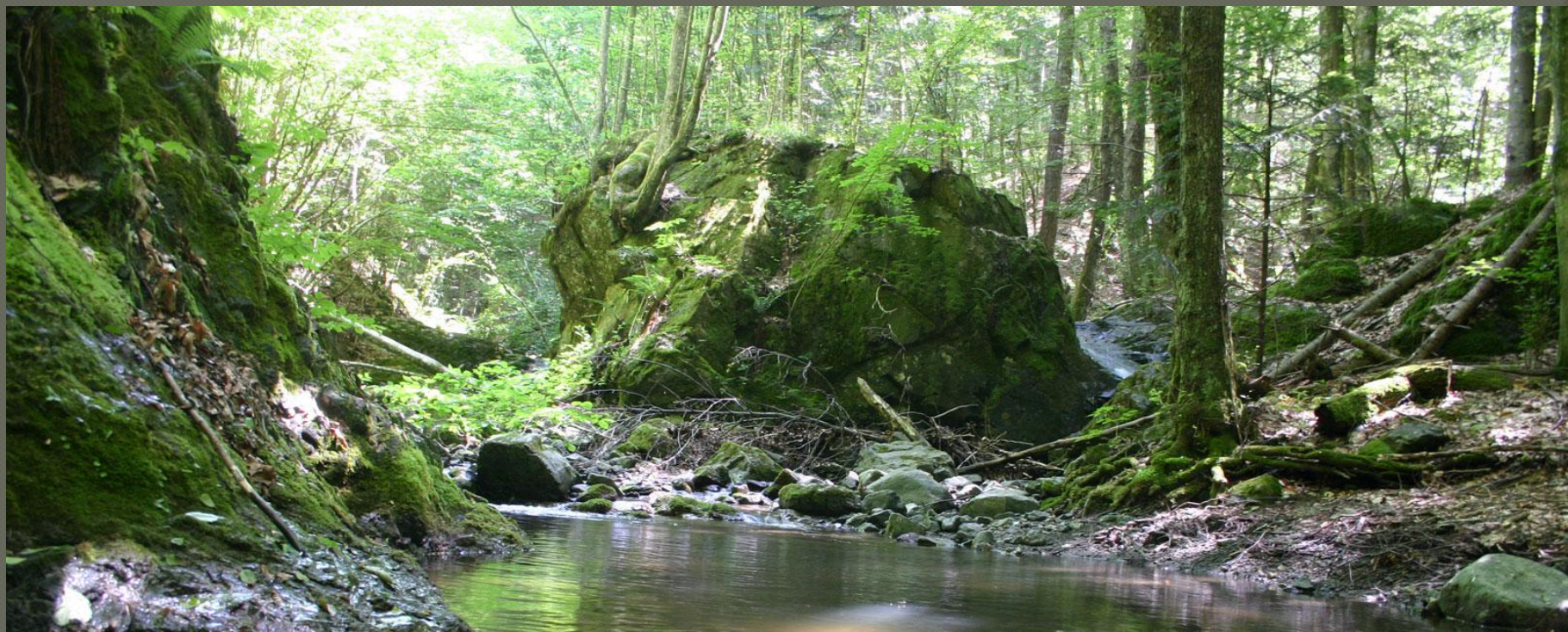
Národný park Kozar