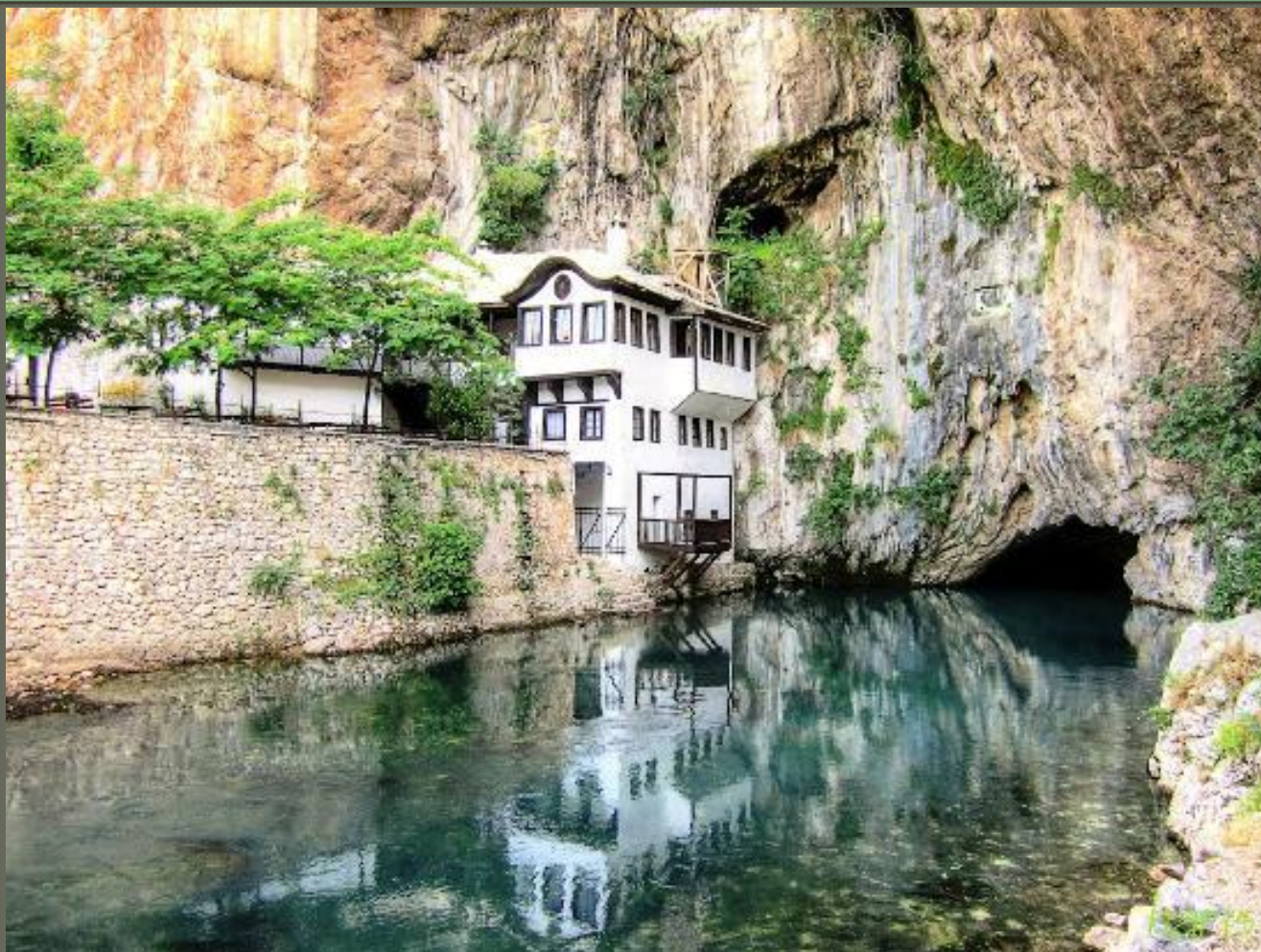
Prameň rieky Buna