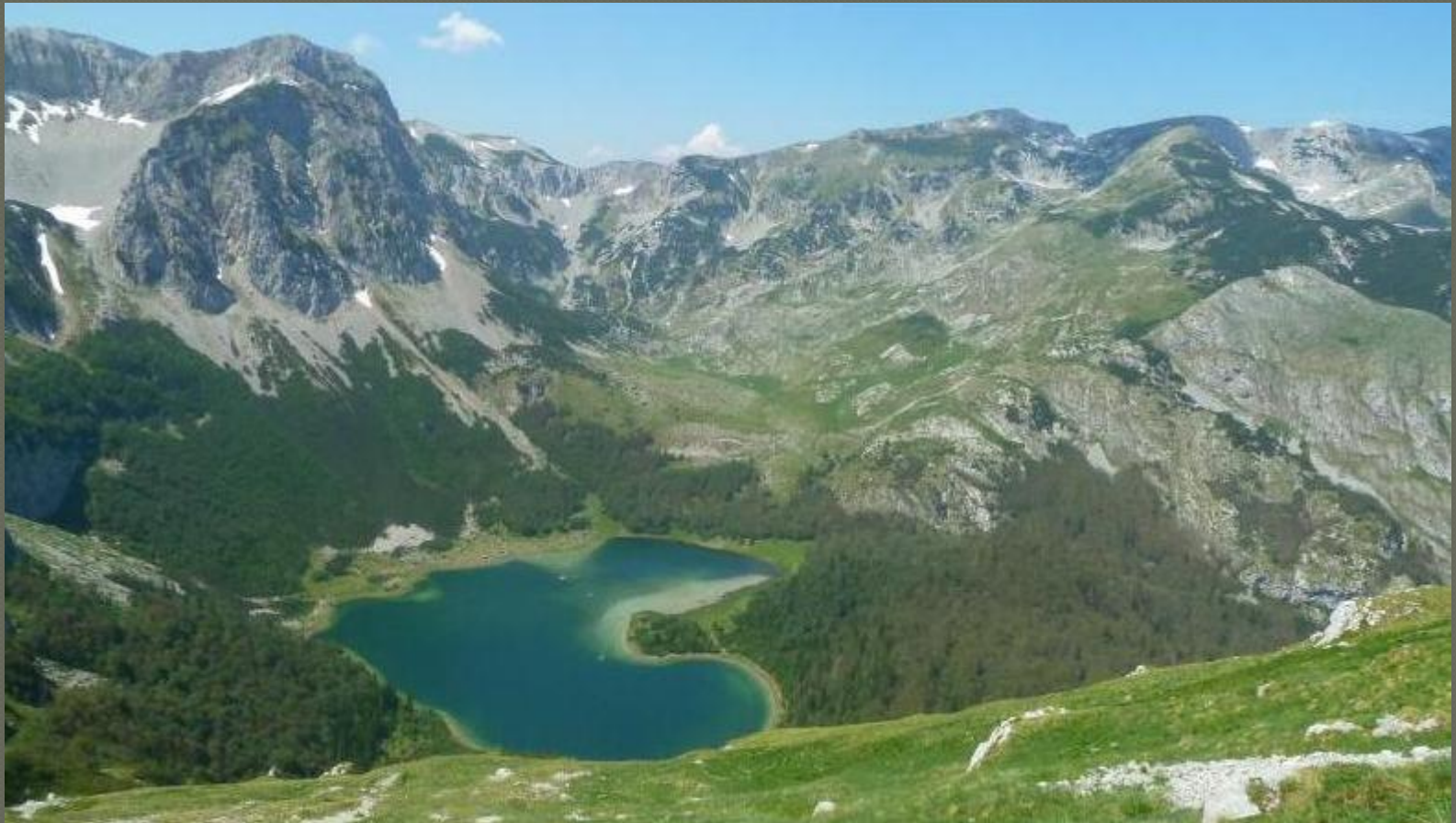
Národný park Sutjeska