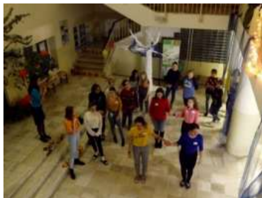
Obrázok 4 Ukáž čo vieš

Počas podujatia sme ponúkali ochutené vody a sladký dezert s malinami. Odmenou pre víťazov, a tými boli všetci, bola sladká pozornosť a samozrejme získané vedomosti.