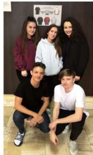
Obrázok 6 Ponúkané produkty

Vyšším levelom našej činnosti bol predaj tričiek a mikín s logom školy a firmy. Na webovej stránke firmy sme si najskôr urobili prieskum trhu o akú farbu mikiny a trička budú mať zákazníci záujem. Našli sme si vhodného dodávateľa týchto komodít a následne formou záväznej internetovej objednávky sme ponúkali tričká v dvoch farbách (čierna a biela) a mikinu v troch farbách (šivá, bordová, čierna). Naše očakávania sa splnili. Každý, kto si mikinu a tričko objednal, si ho aj kúpil. Tým, že sme prieskum trhu robili medzi rokmi, nákupná cena sa zmenila smerom dolu (v náš prospech) oproti avízovaným cenám. Okrem vzhľadného produktu, ktorý naplnil estetické a funkčné očakávania všetkých zúčastnených, sme dosiahli aj pekný zisk.