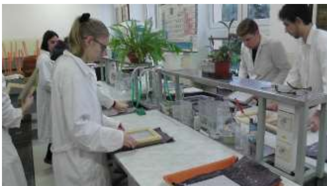
Obrázok 5 Vianočná burza - výroba a predaj výrobkov