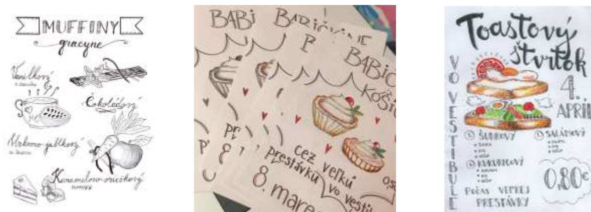
Obrázok 2 Plagáty na doplnkový predaj

Počas fungovania firmy sme zistili, že je veľmi náročné prilákať žiakov na naše podujatia, presvedčiť ich prečo si majú kúpiť práve tento tovar, ktorý my ponúkame. Nedajú sa zlákať bez reklamy, propagácie, len na meno firmy. Každú akciu sme museli veľmi starostlivo spropagovať, nakresliť plagáty, rozvešať po celej škole a ešte poistiť krátkou správou v školskom rozhlase a to nám zabezpečilo dostatočnú účasť žiakov.