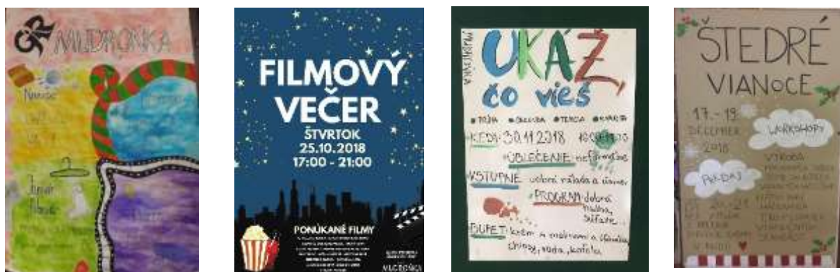
Obrázok 1 Plagáty na školské akcie