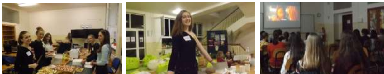
Obrázok 3 Príprava a predaj občerstvenia

Na tento mesiac sme si pripravili akciu s názvom „Filmový večer“. V jednotlivých triedach sa premietali filmy v anglickom, nemeckom, francúzskom, ruskom a samozrejme v slovenskom jazyku. Na chodbách sa predávala ochutená voda, maslový a slaný popcorn. Hlavným pozitívom tejto akcie bolo, že práve vďaka tomuto podujatiu sme sa dostali do povedomia žiakov a tým sme si zabezpečili stálych zákazníkov.