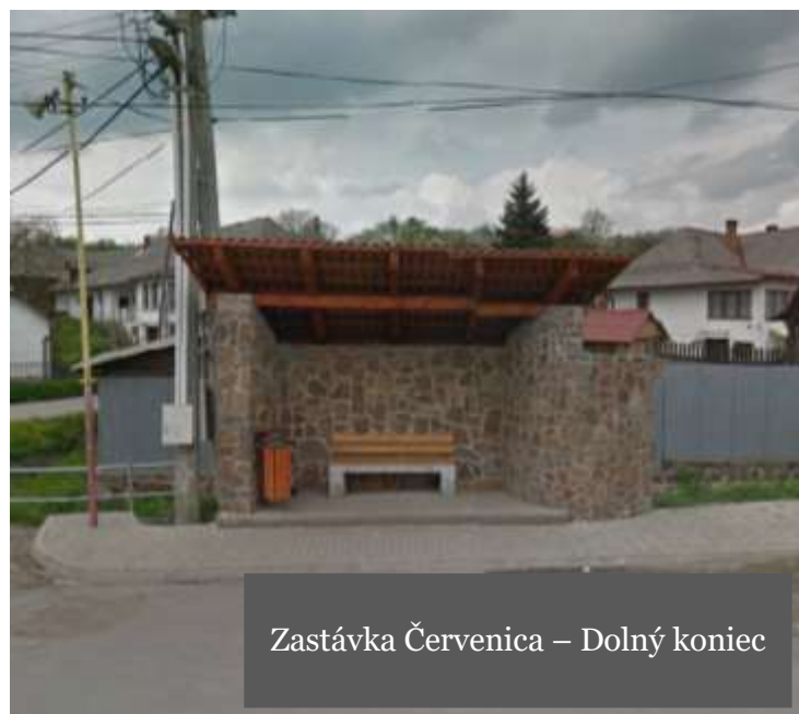
Zastávka Červenica – Dolný koniec