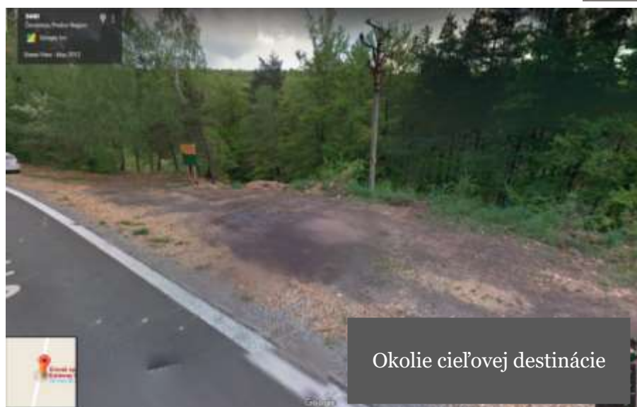
Okolie cieľovej destinácie