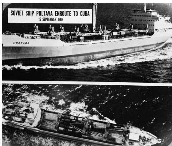
Obrázok 1 - sovietske lode smerujúce na Kubu

Na sledovanie pohybu Sovietov na území Kuby využívali Američania špionážne lietadlá U-2, ktoré lietali vo vysokej nadmorskej výške a boli vybavené kamerami s vysokým rozlíšením. 28. augusta zachytili kamery na fotografie protiletadlové zbrane, čo znamenalo, že Sovieti chránia niečo dôležité. Nakoniec v Národnom centre pre výskum fotografií objavili na záberoch isté nezrovnalosti. Nakoniec zistili, že to boli balistické strely stredného doletu s jadrovými hlavicami, ktoré mali dolet 3200 km a mohli z Kuby zasiahnuť Washington, celé juhovýchodné územie USA a ďalšie strategické ciele. 16. októbra o tomto zistení informovali prezidenta USA Johna Fitzgeralda Kennedyho a skupinu okolo neho. Neskôr bola táto skupina nazývaná Výkonný výbor rady pre národnú bezpečnosť.