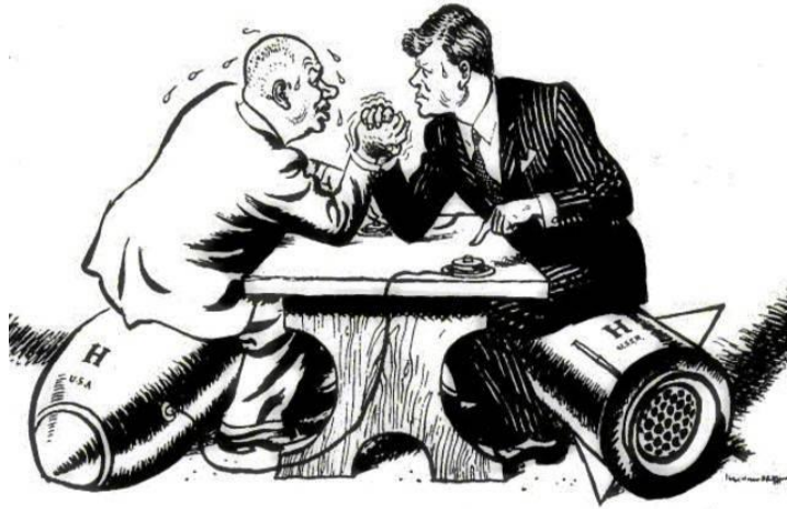
Obrázok 5 - dobová karikatúra zobrazujúca Kennedyho a Chruščova

hodín. Zároveň uviedol, že ak sa tak stane, Spojené štáty upustia od blokády Kuby a budú garantovať jej bezpečnosť.