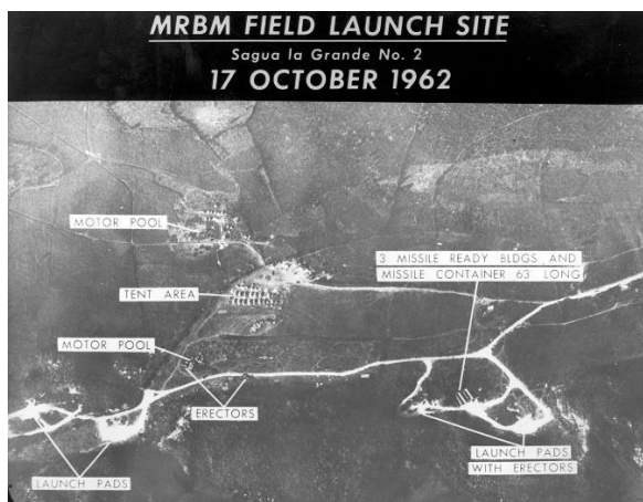
Obrázok 2 - rozmiestnenie striel na Kube