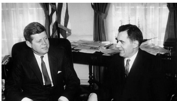
Obrázok 3 - stretnutie Kennedyho s Gromykovom

18. októbra sa prezident Kennedy stretol so sovietskym ministrom zahraničných vecí A. A. Gromykovom aby diskutovali o povahe prevozu zbraní na Kubu. Gromykov poprel prítomnosť akýchkoľvek útočných zbraní. Kennedy mohol dokázať opak, ale nekonfrontoval ho s dôkazmi z taktických dôvodov. Invázia na Kubu bola zatiaľ odložená. Taktiež sa zrušil plán leteckého bombardovania, nakoľko zistili, že minimálne jedna sovietska balistická jednotka je pripravená. Nevedeli ani o početných sovietskych jednotkách na Kube.