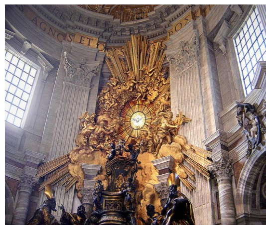
Cathedra Petri, 1656 – 1666, bronz, polychrómovaný mramor, pozlátená štika, výška asi 20 m