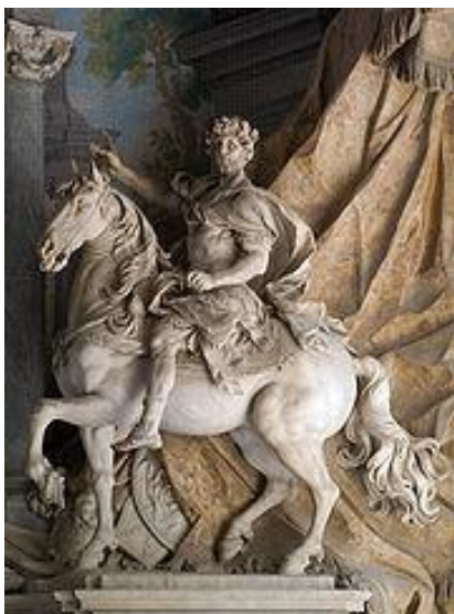
Jazdecká socha Karola Veľkého od Agostina Cornacchiniho z roku 1725 vo vestibule baziliky