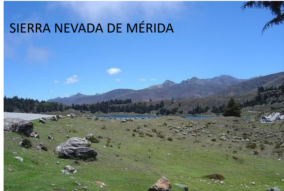
SIERRA NEVADA DE MÉRIDA