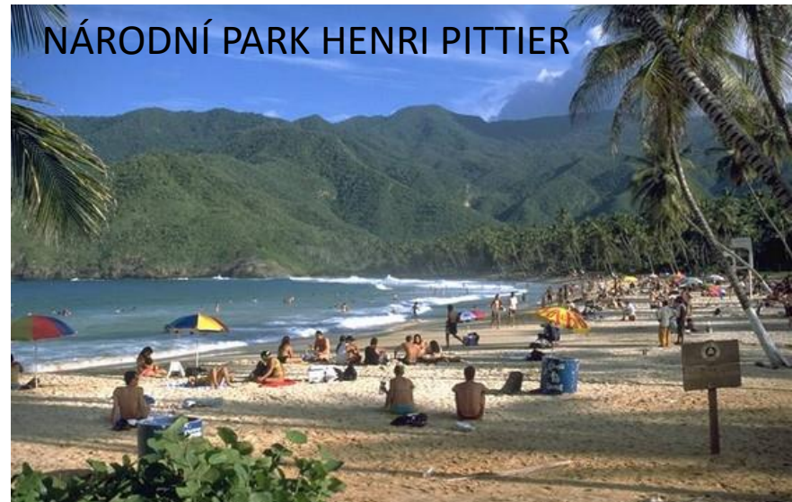
NÁRODNÍ PARK HENRI PITTIER